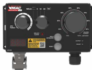
Boîte de contrôle/affichage numérique